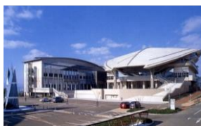
(写真:センター全景)